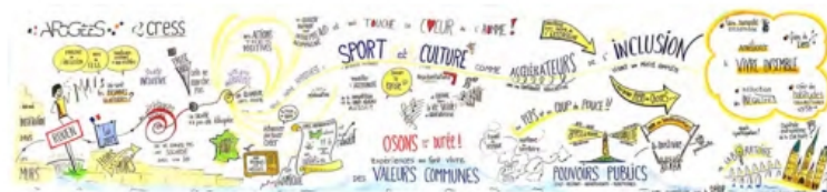
Une fresque de 6 mètres réalisée en live lors d'un séminaire de 2 jours à Rouen.

et vos réussites vous donneront envie d'innover encore plus dans ce chemin passionnant de la facilitation graphique en live ... !